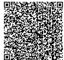
Abbildung 2: 2D-Barcode (Beispiel)

Auch hierbei kann der Barcode-Reader ZXing gut eingesetzt werden, wie unter 1. beschrieben. Ebenso E-Mail oder z. B. Evernote zur Übergabe des Links oder der Textinformation aus dem 2D-Barcode.