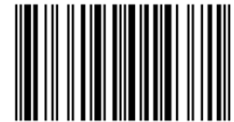
Abbildung 1: 1D-Barcode (Beispiel)

Empfehlung: Zusätzlich nach dem Scannen der Barcodes die Titelblätter (und evtl. die Bucheinbände) fotografieren, damit man notfalls zu Hause damit nachrecherchieren kann. Nicht zu jeder ISBN findet man leicht den Titel in einem Online-Katalog.