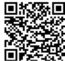
Abbildung 5: Codex

Nach meinen Erfahrungen werden deutschsprachige und englischsprachige Titel recht gut gefunden, französischsprachige leider nicht; als Online-Katalog dient gegenwärtig nur Google Books .